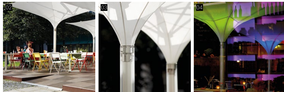
04 Reizvolle Fassadenspiegelung, der steuerbaren LED-Beleuchtung. Attractive reflection of the controllable LED lighting.