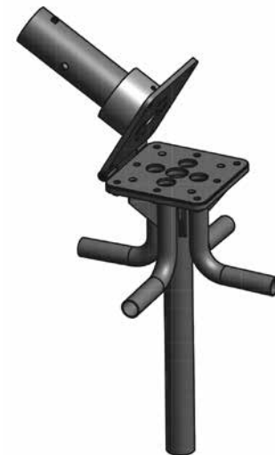
05 Einbauteil Installation part